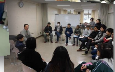
仕事の話を聞く会